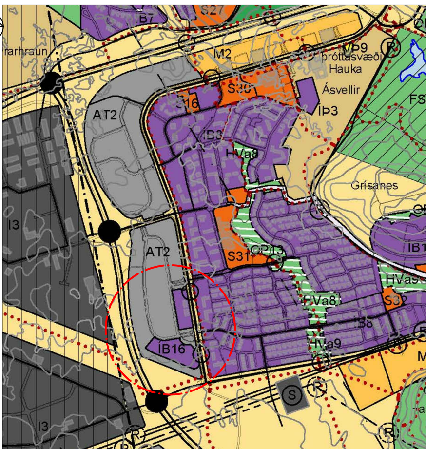
Breytt landnotkun ——— Mörk breyting 1:15.000