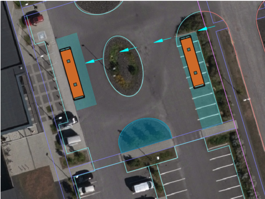
MYND 5 Möguleg útfærsla að tillögu 1.2. Notast er við sömu útfærslu og við tillögu 1, taka þarf bílastæði og gera „miðeyju“ yfirkeyranlega. Hins vegar er ekki þörf á að aðlaga göngustíga eða að gera stoppistöðvarpall. Gera má ráð fyrir að vegfarendur úr Haukaheimili velji að þvera bílastæðið til að komast að stoppistöðinni (blátt svæði á mynd).