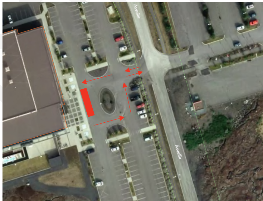
MYND 2 Núverandi ökuleið Strætó og stoppistöð hans við Ásvallalaug.

Strætisvagninn keyrir inn að Ásvallalaug, stöðvar við innganginn, tekur hring á bílplaninu og keyrir svo aftur út af bílastæðinu (akstursleið má sjá á mynd 2).