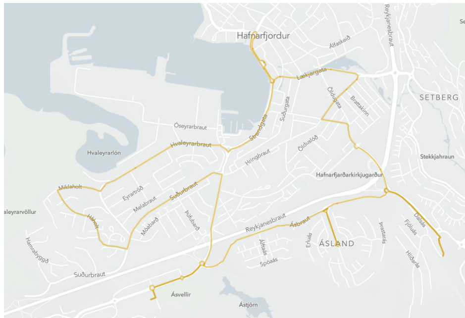
MYND 1 Leið Strætó nr. 44 eins og hún var vorið 2020. Strætó keyrir til og frá Firðinum í Hafnarfirði og stöðvar stuttlega við Ásvallalaug á leið sinni aftur að Firði.

Strætisvagninn keyrir inn að Ásvallalaug, stöðvar við innganginn, tekur hring á bílplaninu og keyrir svo aftur út af bílastæðinu (akstursleið má sjá á mynd 2).