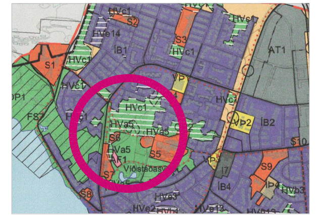
AÐALSKIPULAG HAFNARFJARÐAR 2013-2025

Mörk deiliskipulagsreitsins hopa vegna stækkunar nærliggjandi deiliskipulags, þ.e. svæðið minnkar í samræmi við breytingu á svæðum í Aðalskipulagi Hafnarfjarðar, Opið svæði OP2; Víðistaðasvæði breytist úr 18ha í 17ha. Hverfisverndarsvæði HVc1; Víðistaðasvæði breytist úr 16,2ha í 15,7ha.