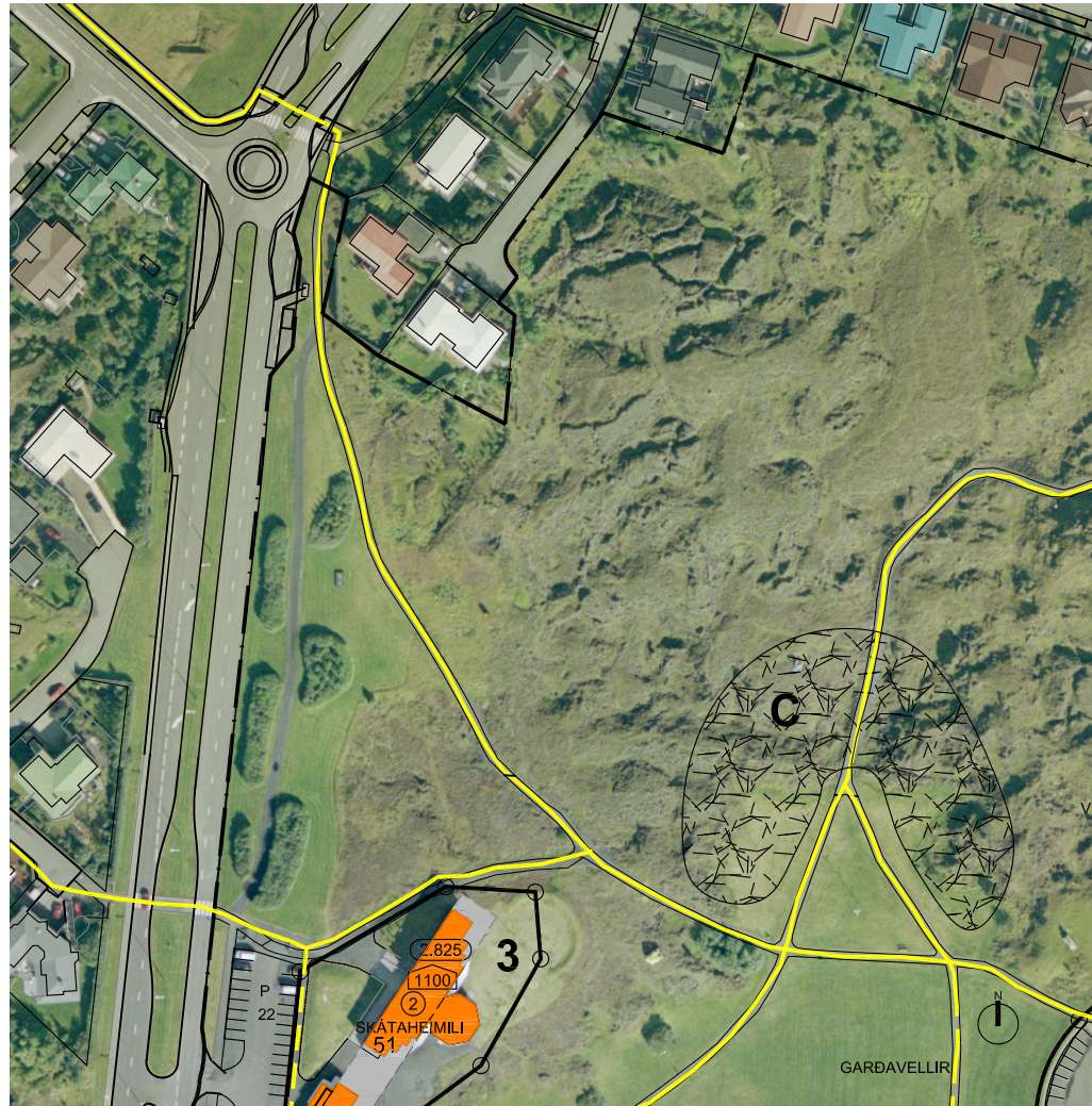
FYRIR BREYTINGU - Í GILDI FRÁ 4.MARS 2003