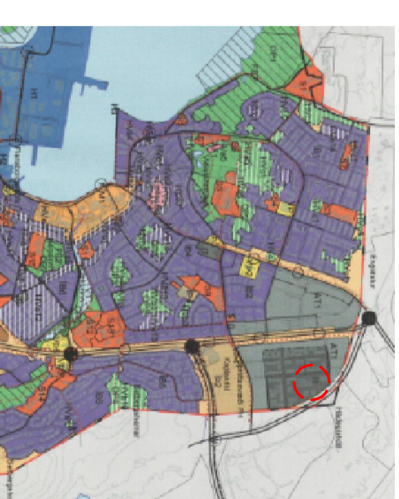
Hluti af aðalskipulagi Hafnarfjarðar. (2013-2025).

GREINARGERÐ: Breytingar á deiliskipulags skilmálum fyrir löðina n. 6 við Skútahraun feila í sér meðal annars að markaður er sérstakur byggingareitur í suðaustur hluta lóðarinnar 1.400 m 2 fyrir ættingarhúsi/ skyli fyrir reykktöfun og þjörgunarsíðir, hluti af þeirri starfsemi telur í sér notkun og meðhöndlun á gæsi. Þá er í norðaustur hluta lóðarinnar armarkaður reitur fyrir neyðarþúnað / þjörgunarbúnað, eins og fátstöðvar og önnur tækni og tól sem nauðsynleg eru vegna starfsemi sem tilheyrir slökkvi og þjörgunarsíðum. Þá er sýnt að löðin verður girt með 2 m hárrí gríðingu. Landhali á á löðarmörkum Skútahrauns 4 og 6 verður leystur er með gríðfíla. Eftir breytingu verður leyfilegt nýtingarhlutfái 0,35. Samkv. mælihláði frá 27. 07. 2008 (iðnaðarsvæði II - Bæjarahraun) er löðin 9.612,5 m 2 . Leyfileg hámarks vegghæð bygginga er: 7,0 m. Leyfileg hámarks mænishæð bygginga er: 9,5 m.