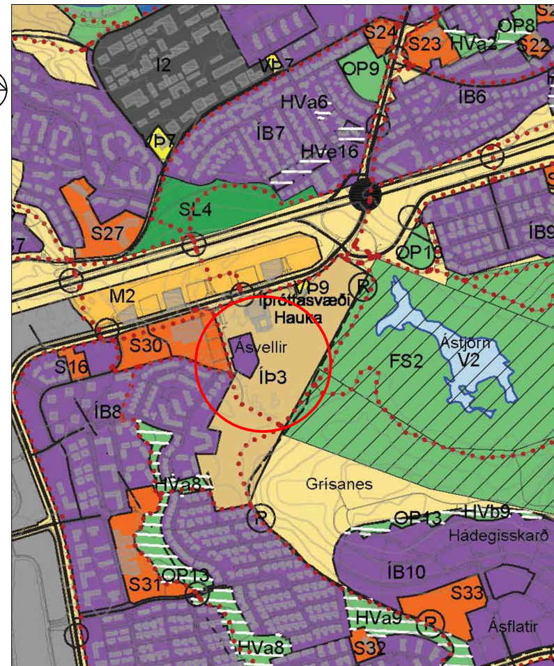
Breytt landnotkun — Mörk breytinga 1:15.000