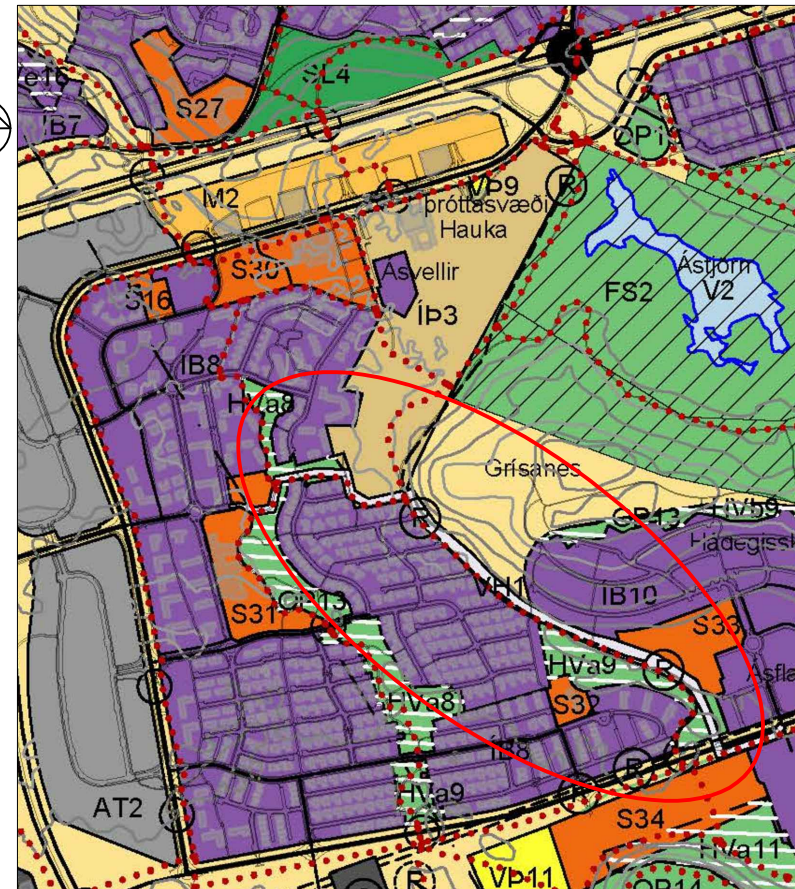
Breytt landnotkun — Mörk breytinga 1:15.000