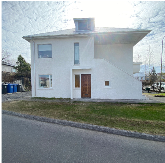
Ljósmynd sem fylgdi með erindinu.