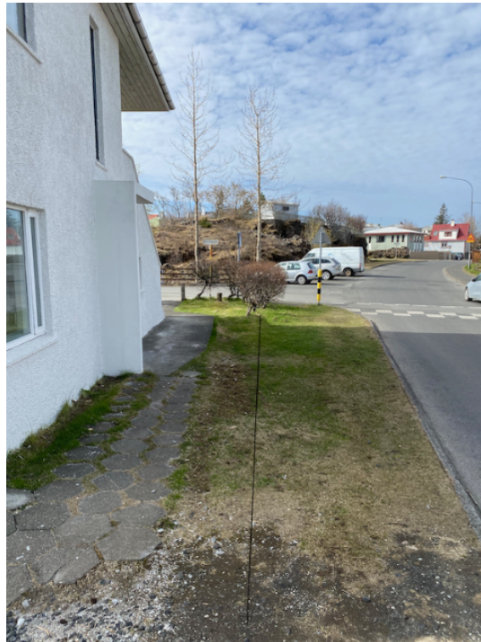
Mynd sem sýnir fyrirhugaða staðsetningu skjólgirðingar

Endurskoðun deiliskipulags er nær til Vesturbæjar er nú í skoðun. Hluti af þeirri vinnu er m.a. að huga að bættu umferðaröryggi og þ.m.t. gerð nýrra og endurbættra gangstétta.