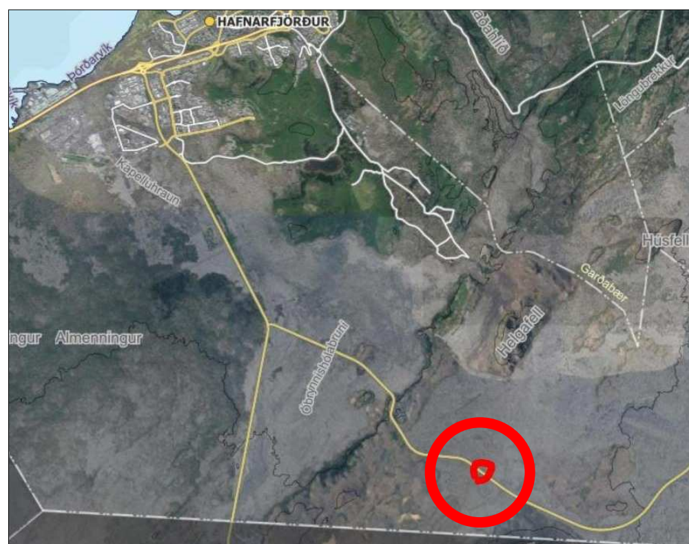
Staðsetningarmynd, klippt af www.map.is/gardabaer