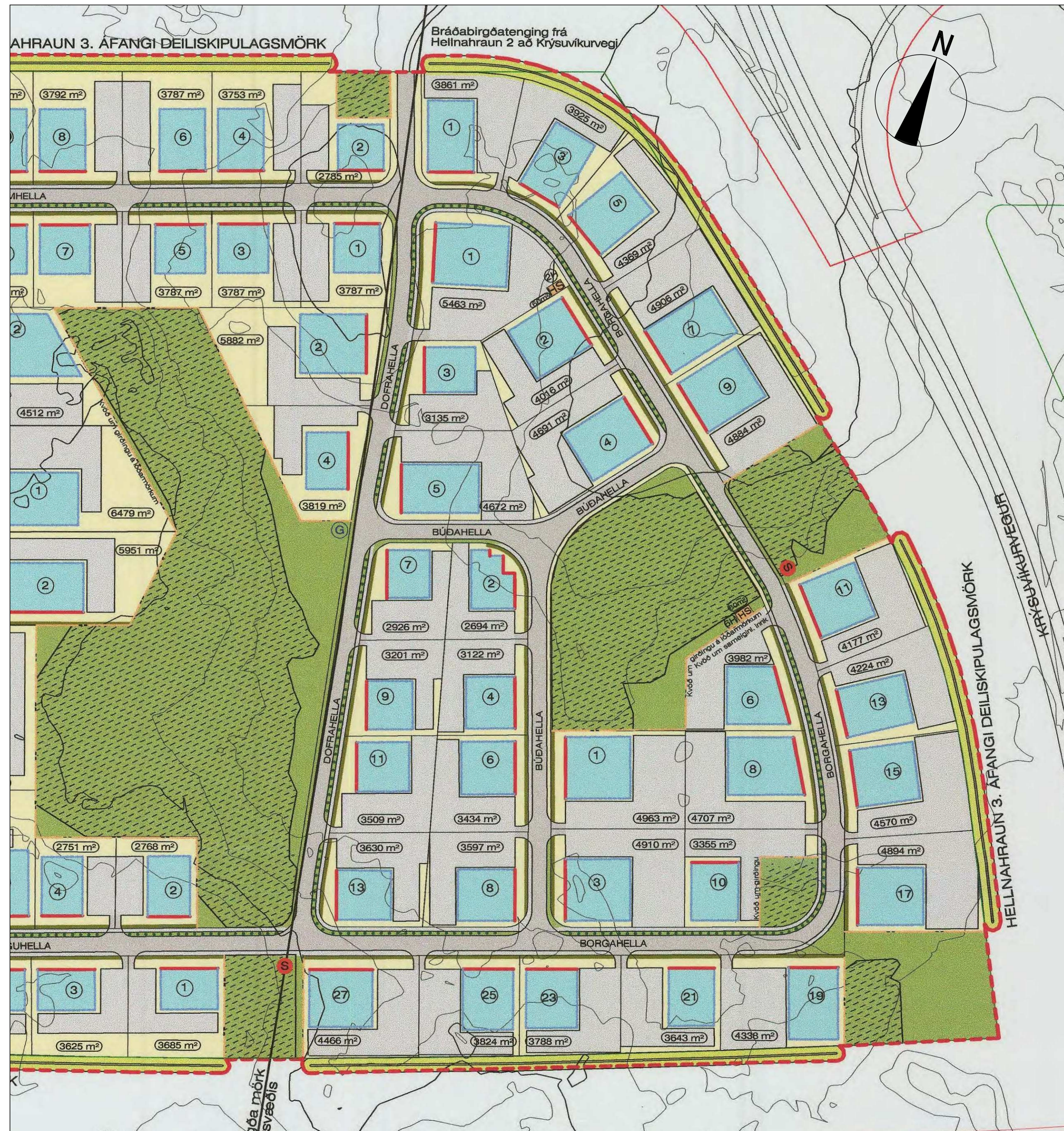
Hluti af gildandi deiliskipulagi Hellnahraun 3. áfangi, samþykkt í bæjarstjórn 26. júní 2007 m.s.br.