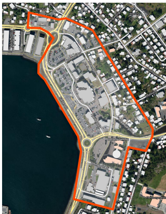
Loftmynd sem sýnir afmörkun miðbæjarsvæðisins M1

Miðbæjarsvæði M1 afmarkast af strandlínunni við Fjarðargötu að hringtorgi við nyðri enda Reykjavíkurvegar, eftir Vesturgötu að Merkur götu upp fyrir safnahús þvert yfir Reykjavíkurveg og í miðlínu Austurgötu yfir lækinn í lóðarmörkum Dvergs reits um miðlínu Suðurgötu meðfram hamrinum við baklóðir Víkingastrætis og niður að strandlínu.