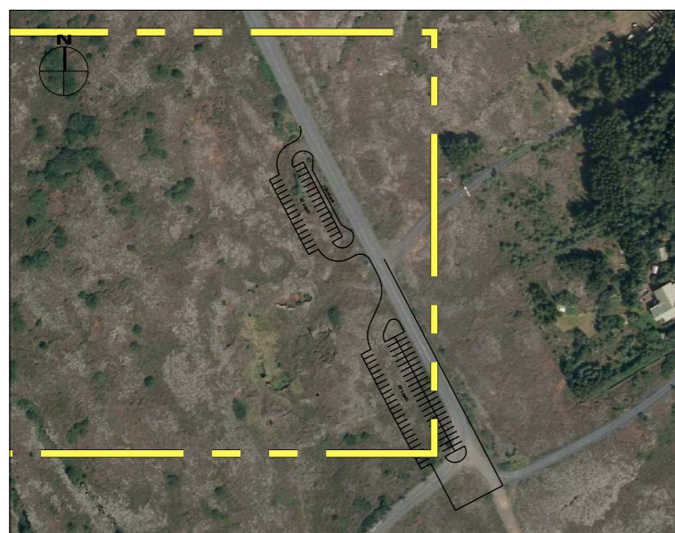
Skýringarmynd af núverandi og væntanlegum bílastæðum í mkv. 1:3000 og einnig í 1:15.000 með vatnsverndarmörkum.