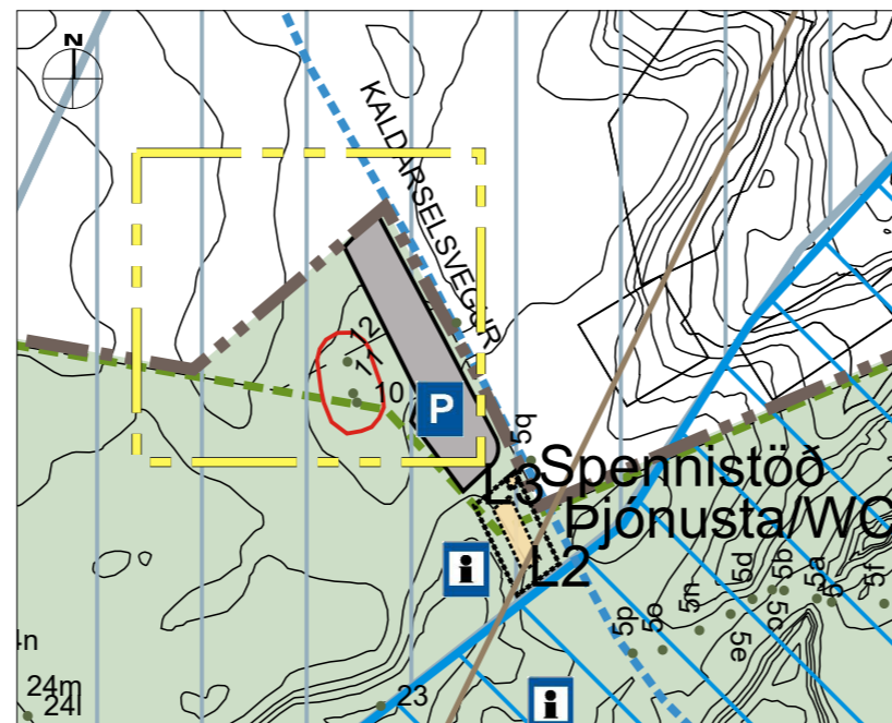
Deiliskipulagsbreyting - tillaga, mkv 1:5000