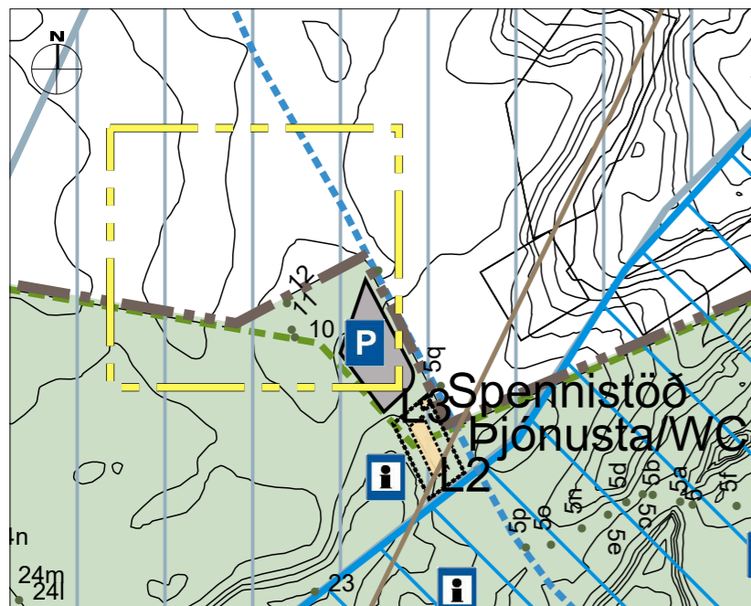
Hluti gildandi deiliskipulags sem tók gildi 29.01.2018, mkv 1:5000