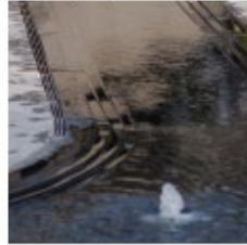
Dæmi um notkun náttúrulegra efna.

Notkun torgsins er breytileg og er það nógu stórt fyrir fjölmenna viðburði svo sem á sjómansdaginn, 17. júní, hafnarþaga og jóla- og matamarkað jafnt sem að þjóna gestum á virkum dögum. Sunnan við torgið er gert ráð fyrir aðstöðu smábátæigenda, aðkomu fyrir ökutæki og skammtímatæði. Torgið verður fullhannað í deiliskipulagi, en lagt er til að koma fyrir gróðri, bekkjum, fallegri lýsingu og jafnvel gosbrunni svo að mæliskvarðinn verði manneskjulegur og torgið verði notalegur og eftirsóttur áfangastaður.