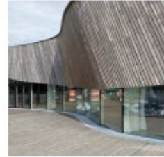
Mynd sýnir lágstemmdan kvæða Hafnartorgsins og notkun náttúrulegra efna.