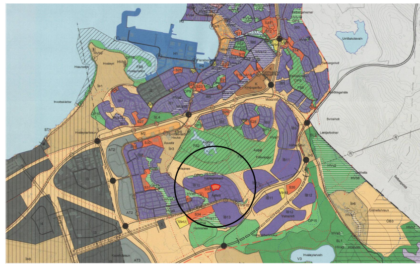
HLUTI AÐALSKIPULAGS HAFNARJARÐAR 2013-2025