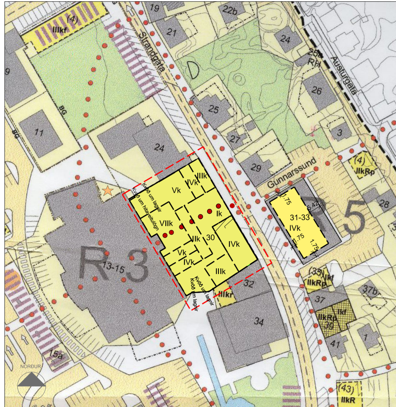
Gildandi deiliskipulag samþykkt í bæjrstjórn Hafnarfjarðar 07.09.2021 Mkv. 1:1000