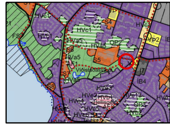
HLUTAMYNÐ - AÐALSKIPULAG HAFNARFJARÐAR 2013 - 2025