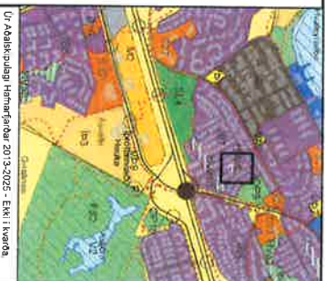
Ur Aðalskipulagi Hinnarfjarðar 2013-2025 - EKK í kvörðu.