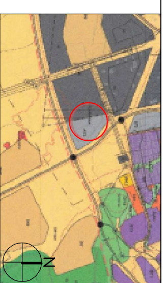
YFIRLIT - HILUTI AÐALSKIPULAGS HAFNARFJ. 2013 - 2025

LÓÐIRNAR BÚÐAHELLA 4 OG 6 ERU SAMEINADAR Í EINA LÓÐ VERÐUR BÚÐAHELLA 4 AÐ ÖÐRU LEYTI GILDA SKILMÁLAR FYRIR HELLNAHRAUN 3. ÁFANGI