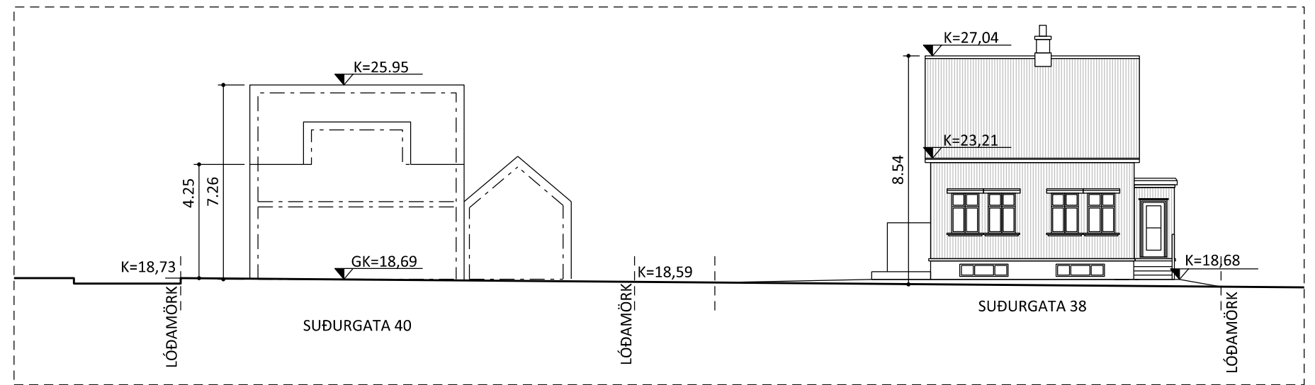
GÖTUMYND, TILLAGA AÐ BREYTTU DEILISKIPULAGI - SUÐURGATA 1:200

Lagt er til að byggingarreitir verði stækkaðar til norð-vesturs. Stækkunin tekur einungis til 1. hæðar og kvista. Enginn kjallari verði í húsinu og hæðir þakskeggs og mænis verði nær þeim sem eru á samsvarandi húsum í næsta nágrenni lóðarinnar. Inngangshæðarkóti verði sem næst hæðarkóta lóðar svo hægt verði að taka tillit til aðgengis fyrir alla. Ris verði þannig að lítið pláss fari til spillis undir súð.