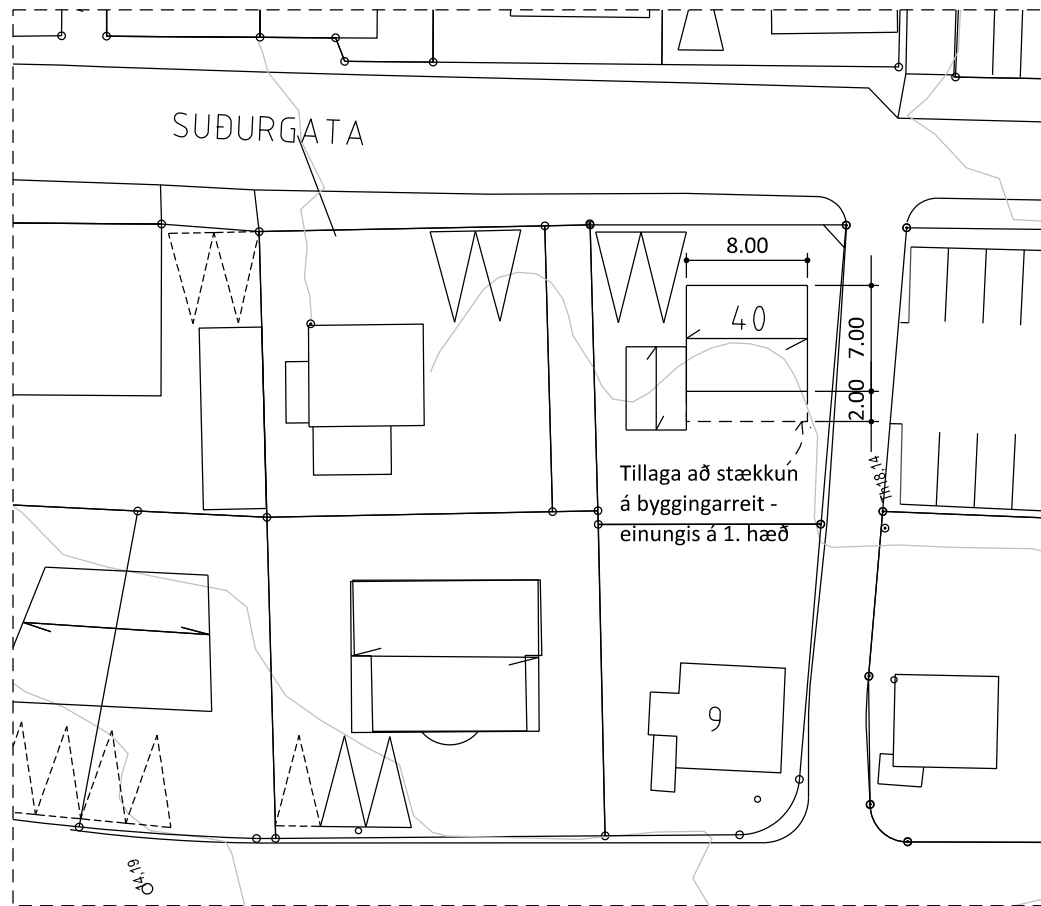
TILLAGA AÐ STÆKKUN Á BYGGINGARREIT V. SUÐURGÖTU 40, 1:500

Lagt er til að byggingarreitir verði stækkaðar til norð-vesturs. Stækkunin tekur einungis til 1. hæðar og kvista. Enginn kjallari verði í húsinu og hæðir þakskeggs og mænis verði nær þeim sem eru á samsvarandi húsum í næsta nágrenni lóðarinnar. Inngangshæðarkóti verði sem næst hæðarkóta lóðar svo hægt verði að taka tillit til aðgengis fyrir alla. Ris verði þannig að lítið pláss fari til spillis undir súð.