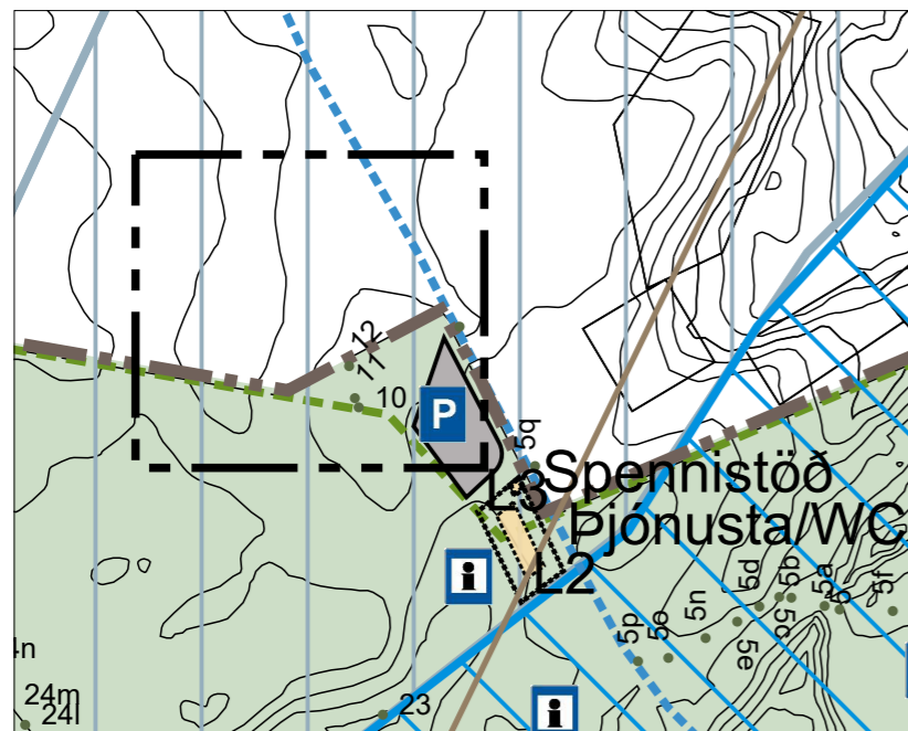
Hluti gildandi deiliskipulags sem tók gildi 29.01.2018