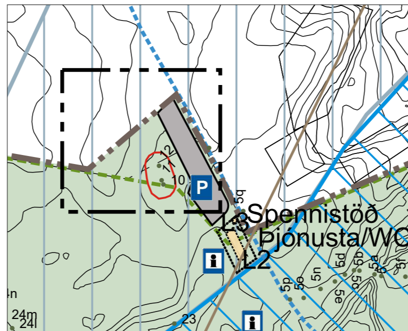
Deiliskipulagsbreyting - tillaga