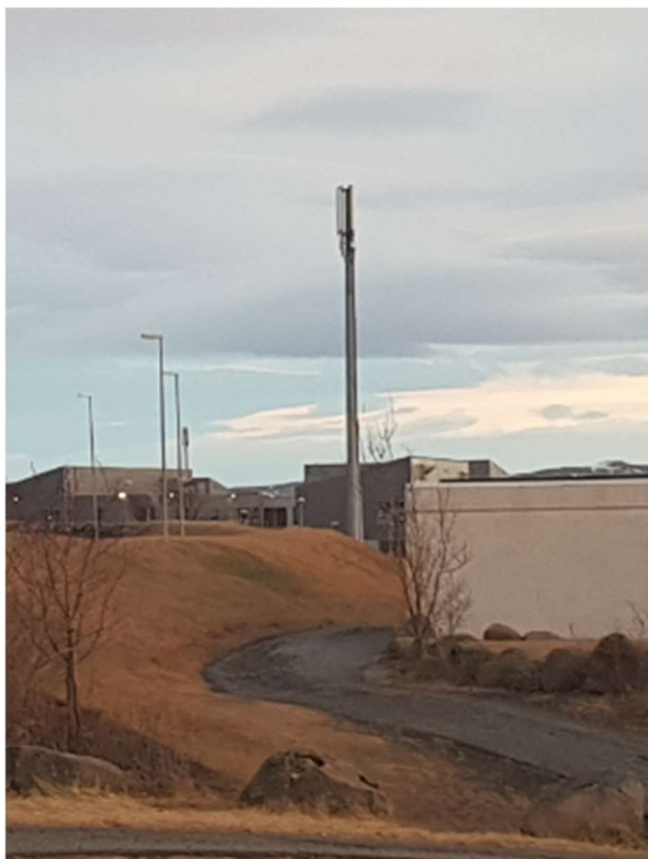
Mynd 5 - Sendastaður við Grandhvarf

Hinn sendastaðurinn er inni á lóð við Þorrasali 19 í Kópavogi og þar er allavega 20metra há stálsúla þar sem fleiri en eitt fyrirtæki samnýta sendastaðinn.