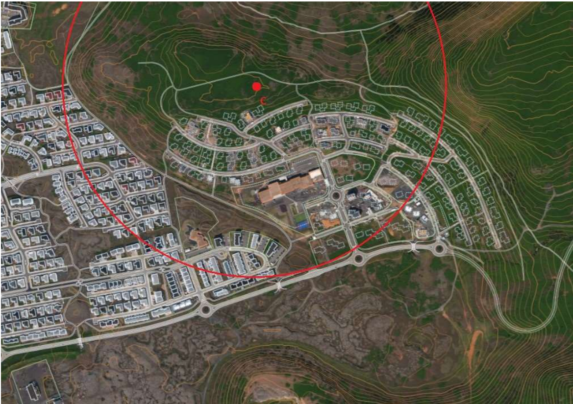
Mynd 3 - Valkostur B og 500 metra drægnisvæði sendistaðar.