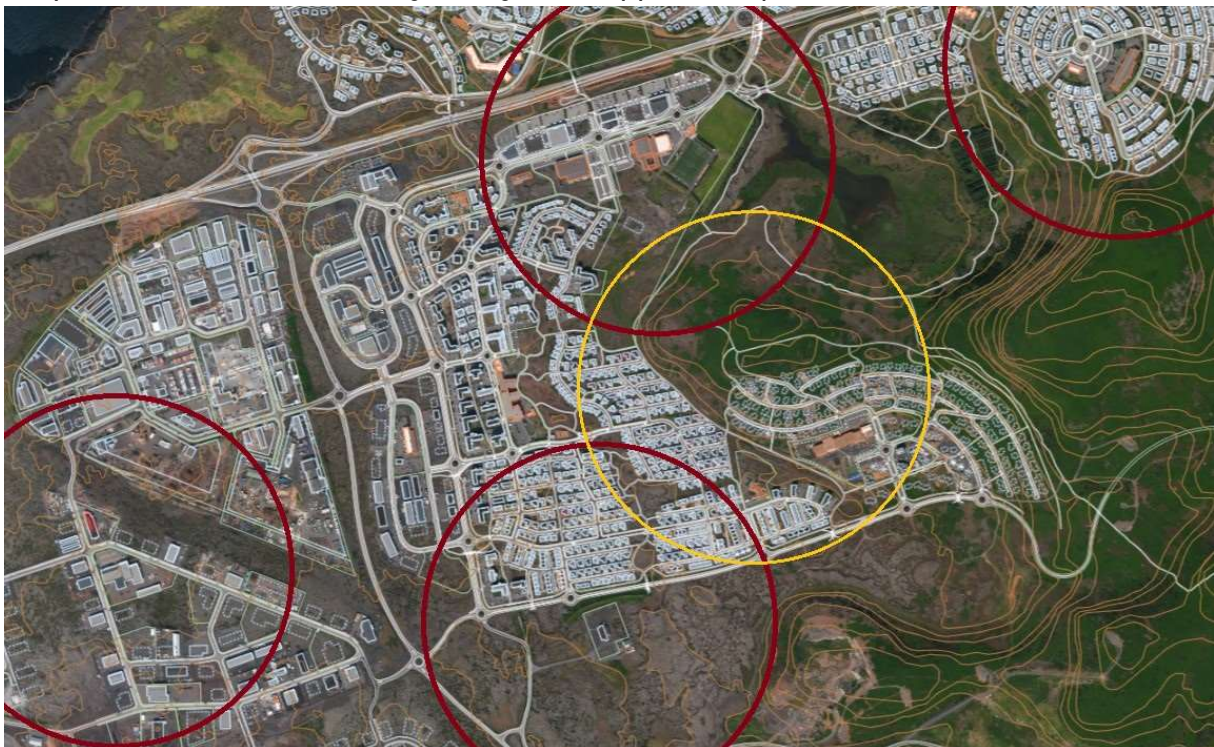
Mynd 4 – Sendastaðir Símans í byrjun árs 2021 og 500m drægnihringir. Gulur hringur er vegna Drangsskarðs 12.

Í dag er Síminn með fimm farsíma sendastaði í Hafnarfirði á svæðum sunnan Reykjanesbrautar. Af þeim eru fjórir í dag á svæðum Vallahverfa og Skarðshliðar. Einn þessara, sá sem er í Drangsskarði 12, er bráðabirgðar staður sem mun þurfa að fara niður á allra næstu misserum. Aðrir sendastaðir er: Áslandsskóli, Ásvellir íþróttamiðstöð, Héðinshúsið og Hamranes. Á mynd 4 eru ca. 500metra drægni-hringir settir upp frá hverjum af ofan nefndum sendastaðum.