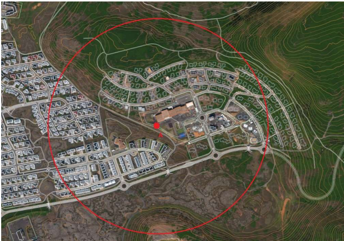
Mynd 1 - Valkostur A og 500 metra drægnisvæði sendistaðar.