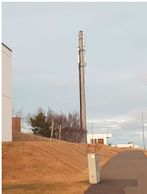
Mynd 6 - Sendastaður við Þorrasali

Einnig er einn sendastaður sem er á hárra stálsúlu (~20m) við Skeiðarás 2 í Garðabæ þar sem Síminn er með farsímapjónustu sem og er yfir 20m hár sendastaður á súlu við Eirhöfða í Reykjavík.