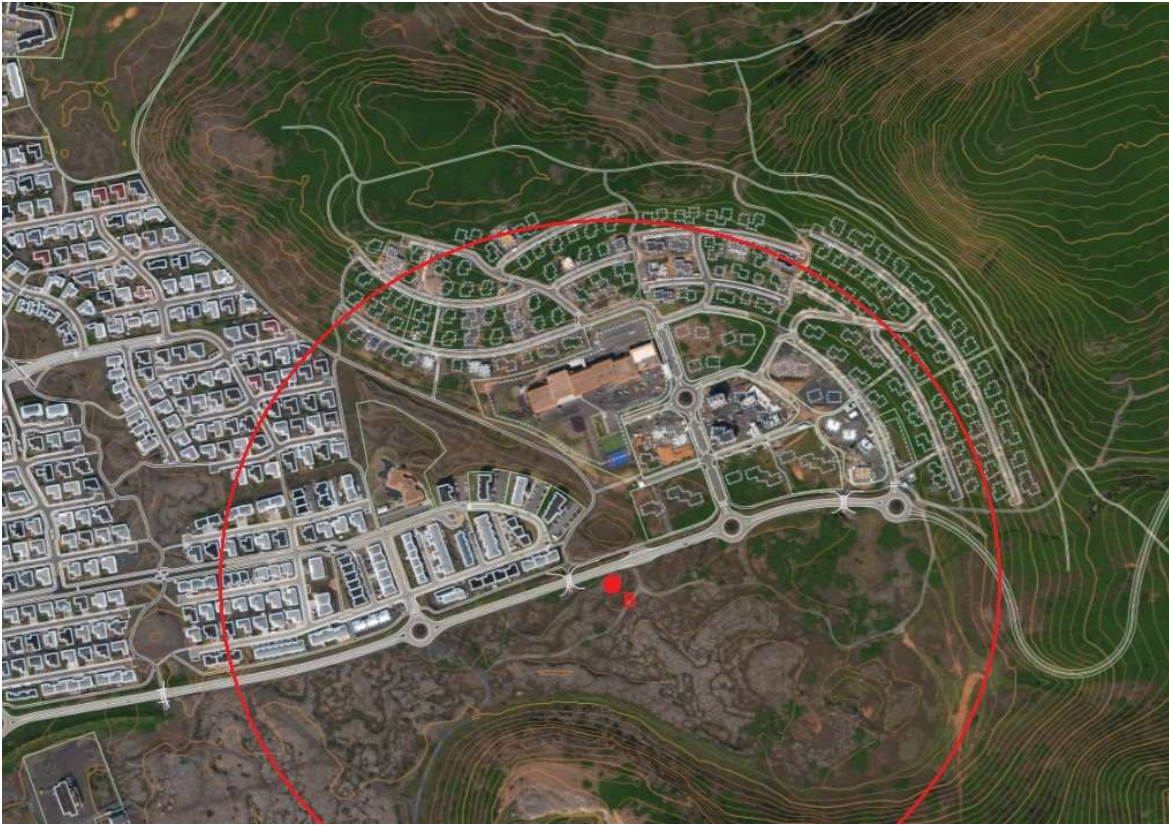
Mynd 2 - Valkostur B og 500 metra drægnisvæði sendistaðar.