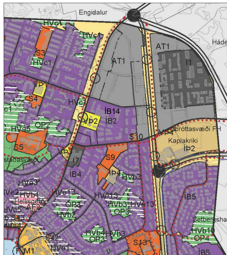
Aðalskipulag Hafnarfjarðar 2013-2025 1:15.000 Staðfest af skipulagsstofnun 20.11.2020