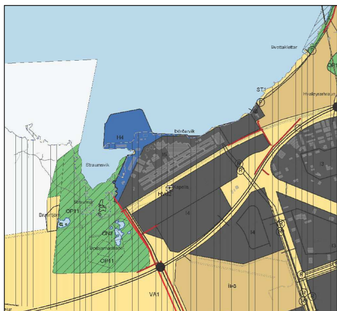
HLUTI GILDANDI AÐALSKIPLAGS 2013 - 2025