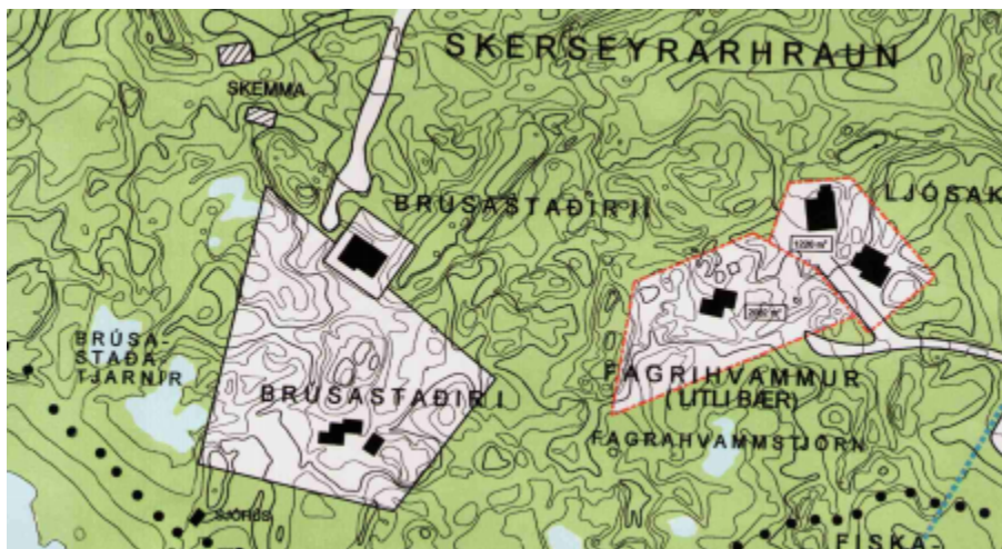
Uppdráttur frá 2001.