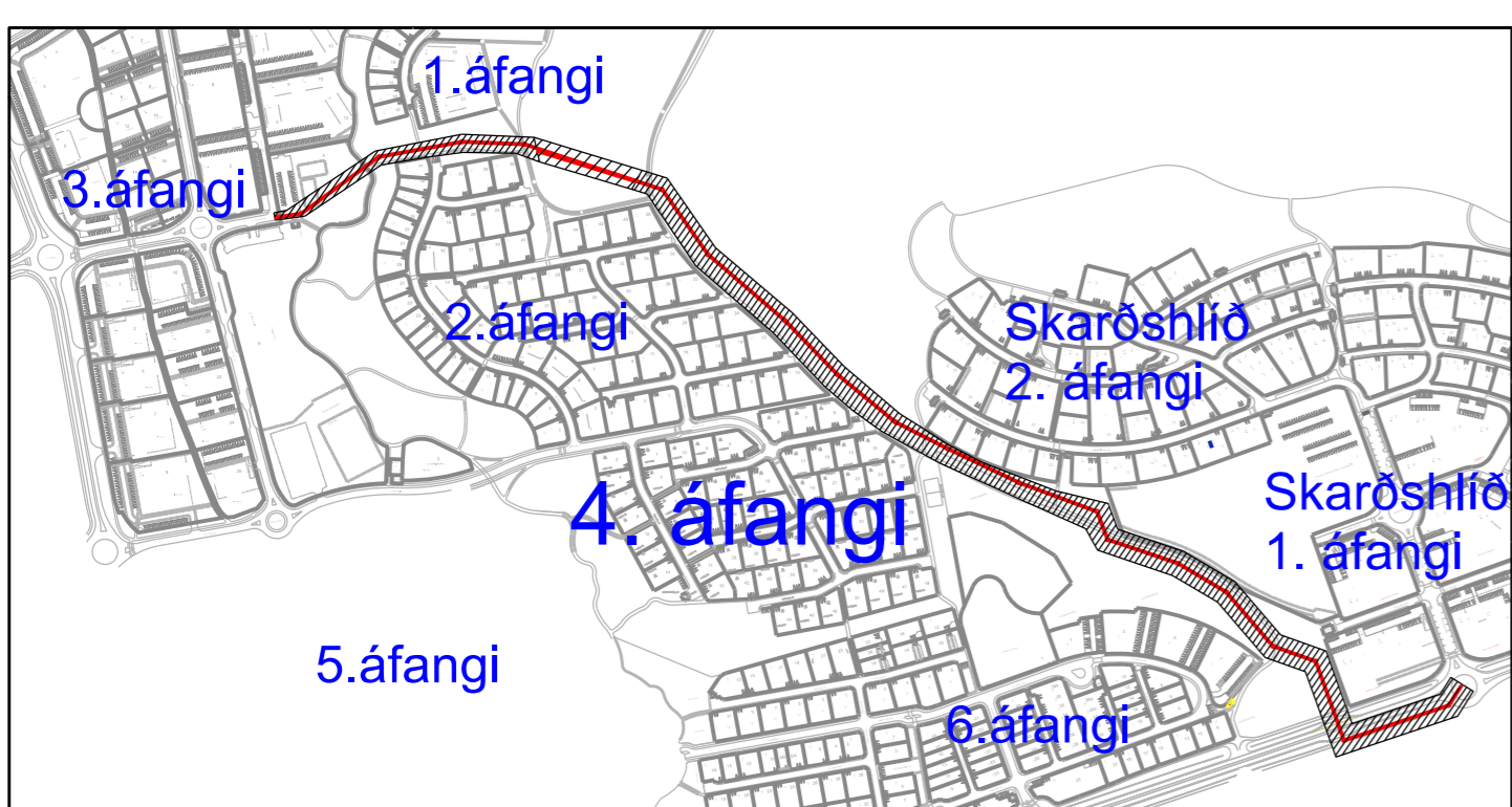
Yfirlitsmynd af Völlum. Ræsi liggur meðfram 4. áfanga. Mkv. 1:7500