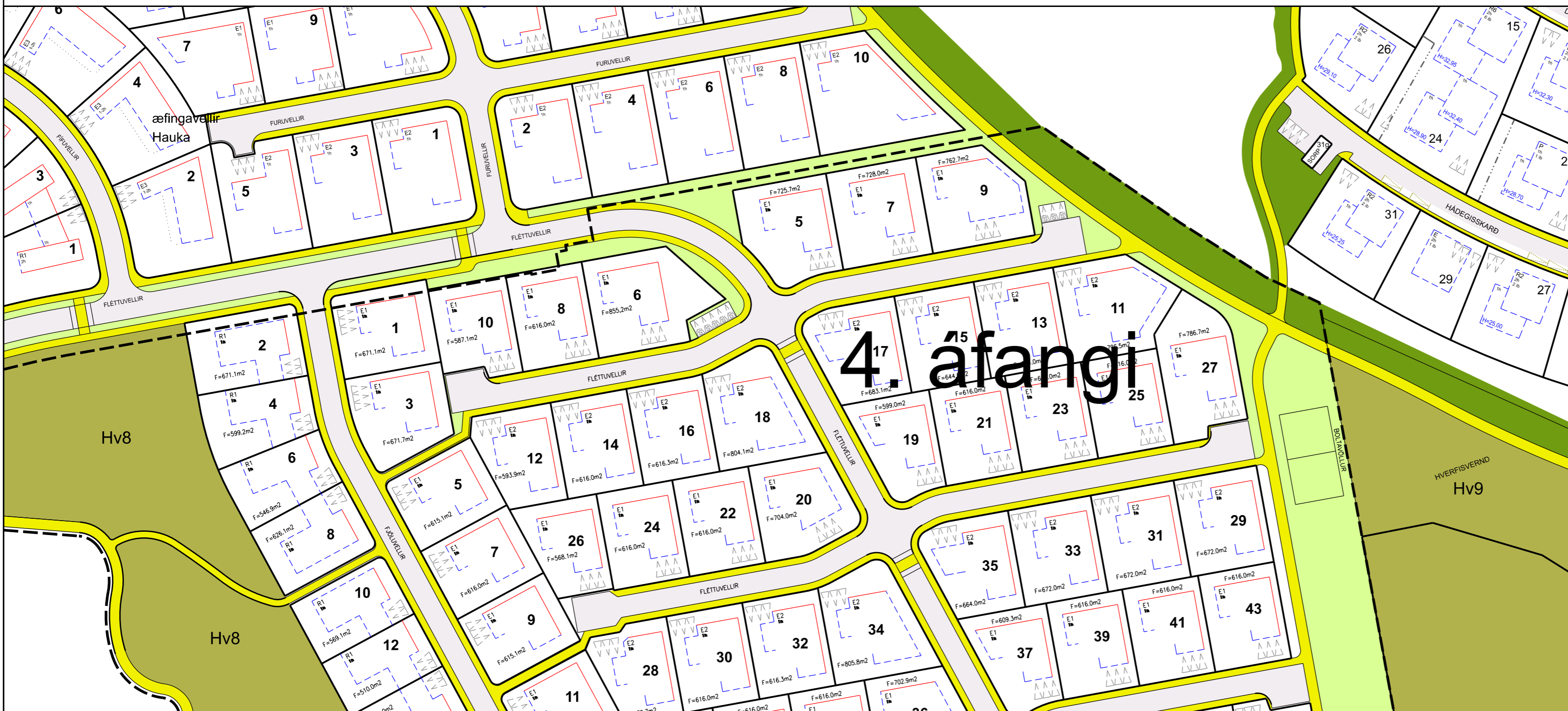
Gildandi deiliskipulag Vellir 2. áfangi. Samþykkt 19.09.2004 m. s. br. Mkv. 1:1000