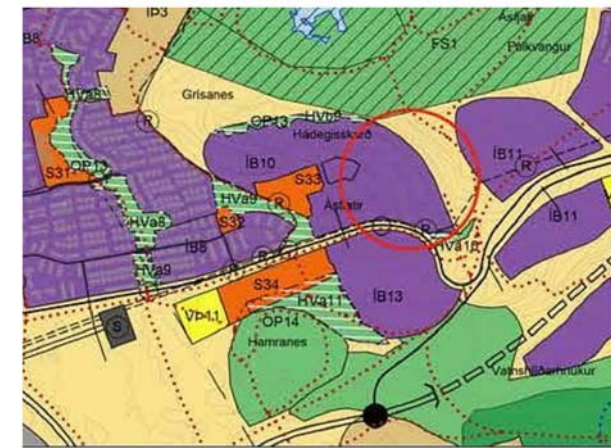
HLUTI ADALSKIPULAGS HAFNARFJARÐAR 2013-2025