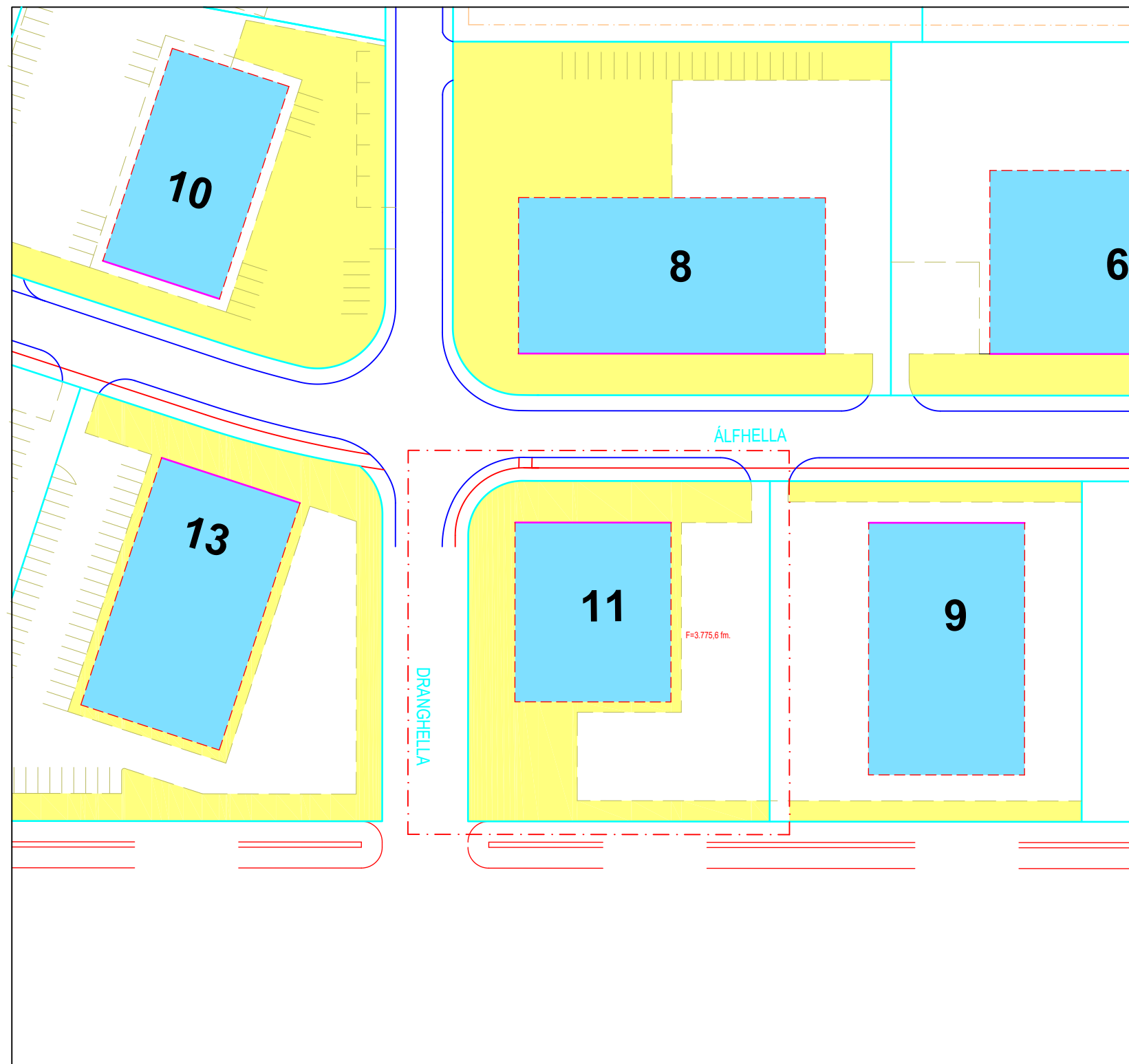
Fyrir breytingu - í gildi frá 11. APRÍL 2011