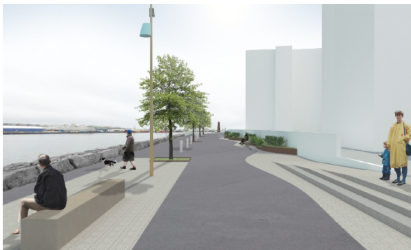
Norðurbakka til lengri tíma litið.

Á fundi hafnarstjórnar þann 12. ágúst sl. var samþykkt að ráðast í útboð á verkinu „Norðurbakki - grjótvörn“ og er framkvæmdin undanfari frekari uppbyggingar og fullnaðarframkvæmda við Strandstíginn og útivistarsvæði á Norðurbakka og við Norðurgarð. Teiknistofan Landslag og verkfræðipjónustan Strendingur hafa unnið að undirbúningi og hönnun verkefnisins í samvinnu við Hafnarfjarðarhöfn og umhverfis- og skipulagssvið Hafnarfjarðarbæjar. Útboð fyrsta áfanga verkefnisins mun verða auglýst nú á næstunni.