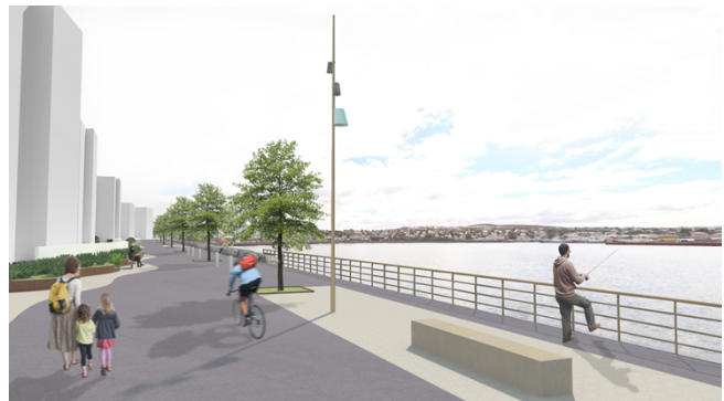
Fjölbreytt og heillandi útivistarsvæði mun rísa á