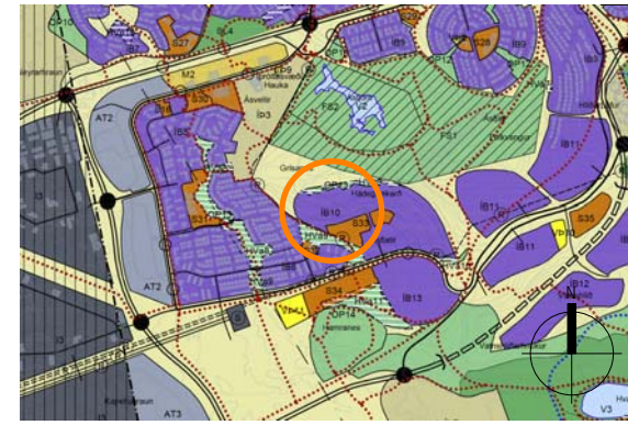
Yfirlit - Hluti Aðalskipulags Hafnarfj. 2013-2025