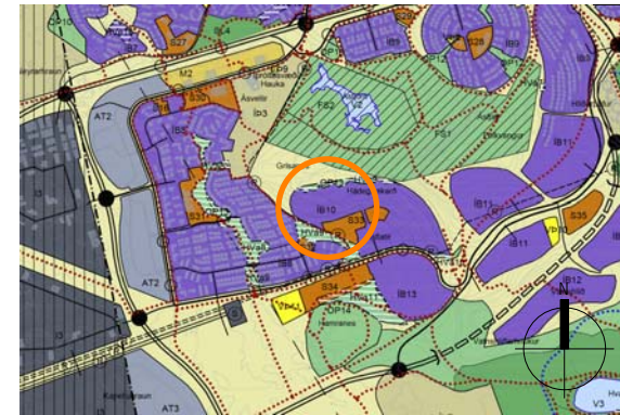
Yfirlit - Hluti Aðalskipulags Hafnarfj. 2013-2025