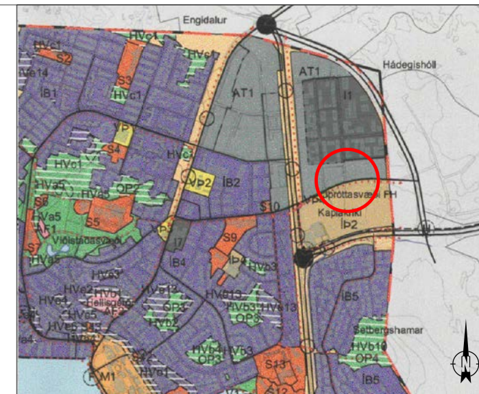
HLUTI ADALSKIPULAGS HAFNARFJARÐAR 2013 - 2025