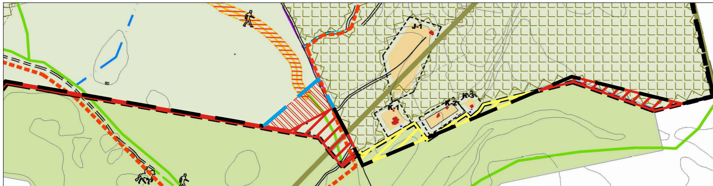
Deiliskipulagsbreyting, breytt afmörkun - Tillaga