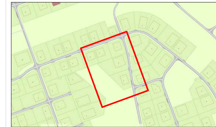
Heiluhraun 3. áfangi - Deiliskipulag