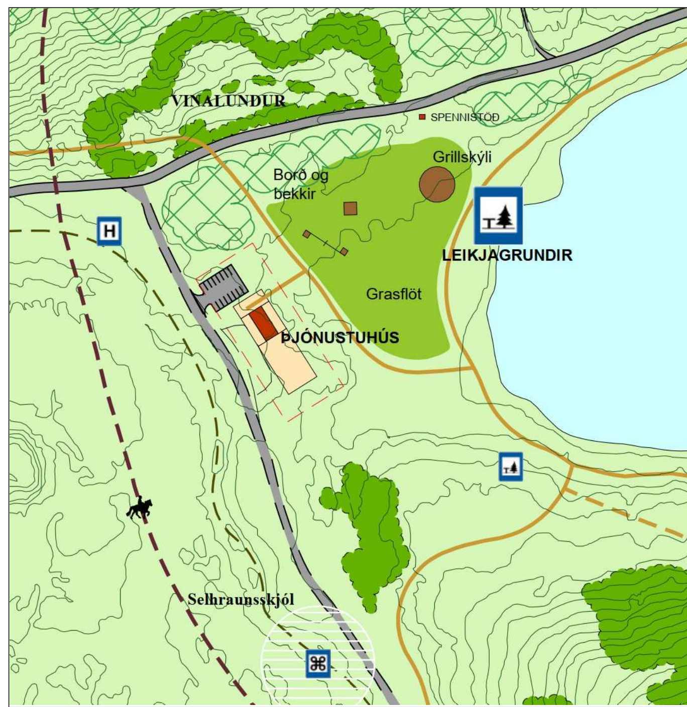
GILDANDI DEILISKIPULAG REITUR 3 - ÞJÓNUSTUHÚS OG LEIKJAGRUNDIR VIÐ VESTURENDA HVALEYRRARVATNS