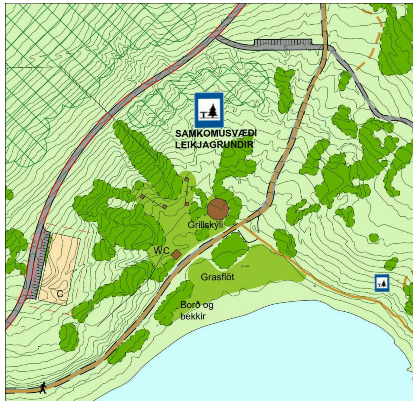
GILDANDI DEILISKIPULAG REITUR 2 - ÁNINGARSTAÐUR OG LEIKJAGRUNDIR VIÐ NORDANVERT HVALEYRRARVATN