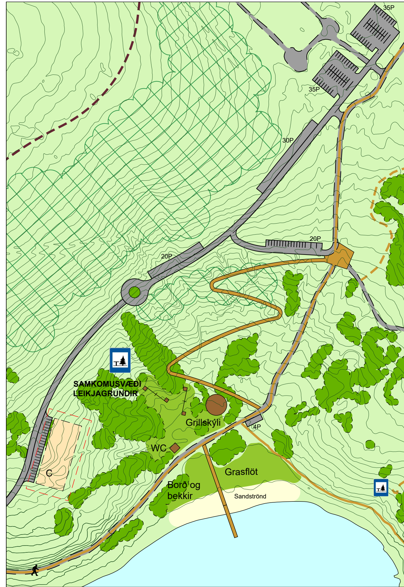
BREYTT DEILISKIPULAG REITUR 2 - ÁNINGARSTAÐUR OG LEIKJAGRUNDIR VIÐ NORDANVERT HVALEYRRARVATN