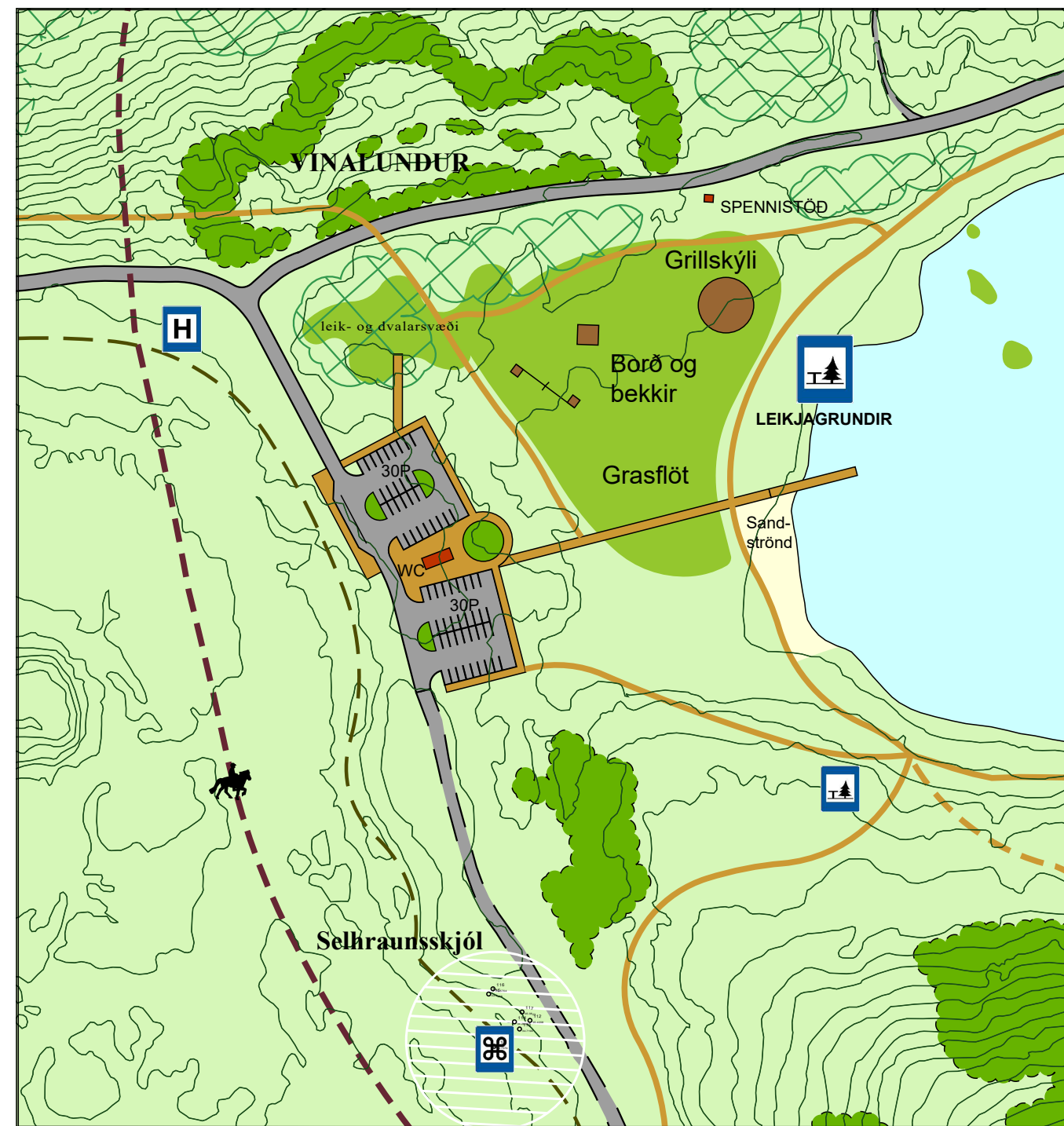
BREYTT DEILISKIPULAG REITUR 3 - ÞJÓNUSTUHÚS OG LEIKJAGRUNDIR VIÐ VESTURENDA HVALEYRRARVATNS