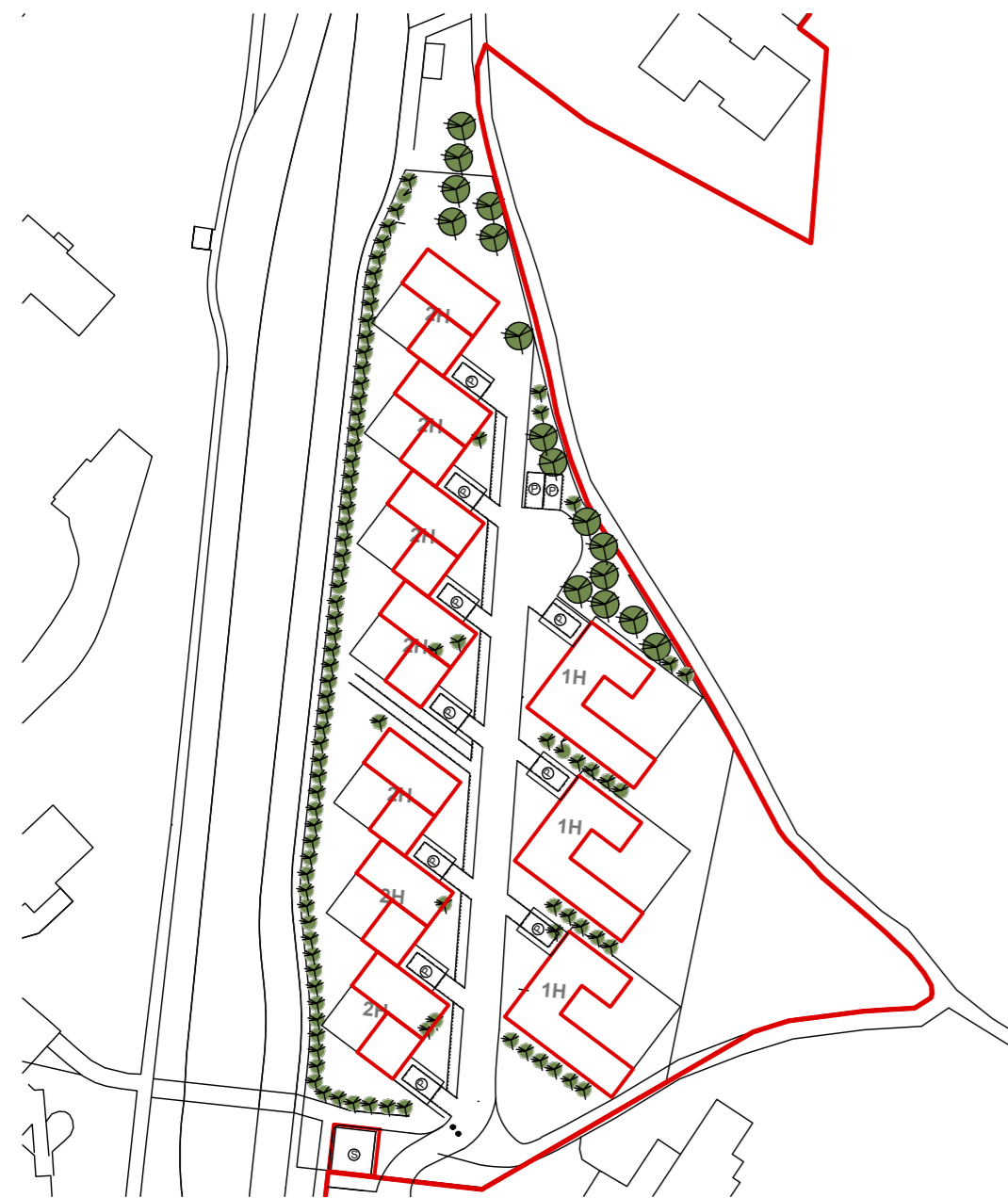
A - Tillaga deiliskipulags - Tvö 2.hæða raðhús, þrjú 1.hæða einbýlishús.