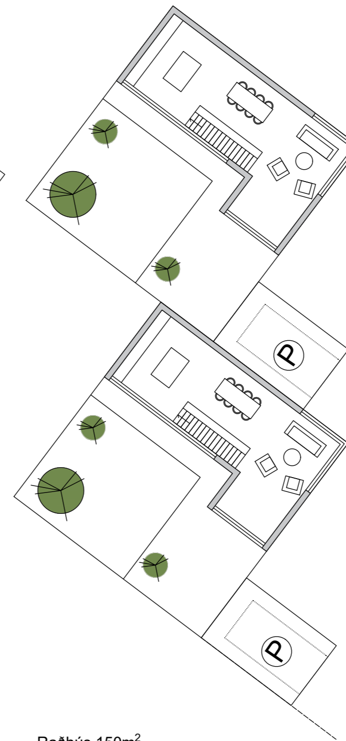
Raðhús 150m 2 Grunnmynd 2.hæð