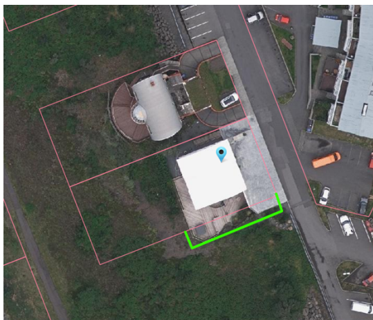
Tillaga að lóðarstækkun

Á loftmyndinni sem sýnir núverandi lóðarmörk sjást lóðarmörkin samkvæmt lóðarleigusamningi (bleik lína). Ljóst er að lóðarhafa hafa farið í töluverða landvinninga. Um óræktað land er að ræða þannig að ekki er verið að ganga á rétt nágretta. Breyting á gildandi deiliskipulagi vegna þessa lóðarstækkunar telst óveruleg og skerðir á engan hátt hagsmuni nágretta hvað varðar landnotkun, útsýni, skuggavarp eða innsýn samanber 43. gr. skipulagslaga. Lagt er til að umrædd lóðarstækkun verði samþykkt.