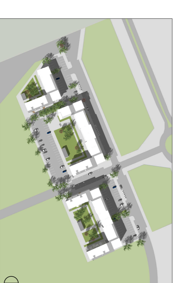
21.06 KL. 10.30