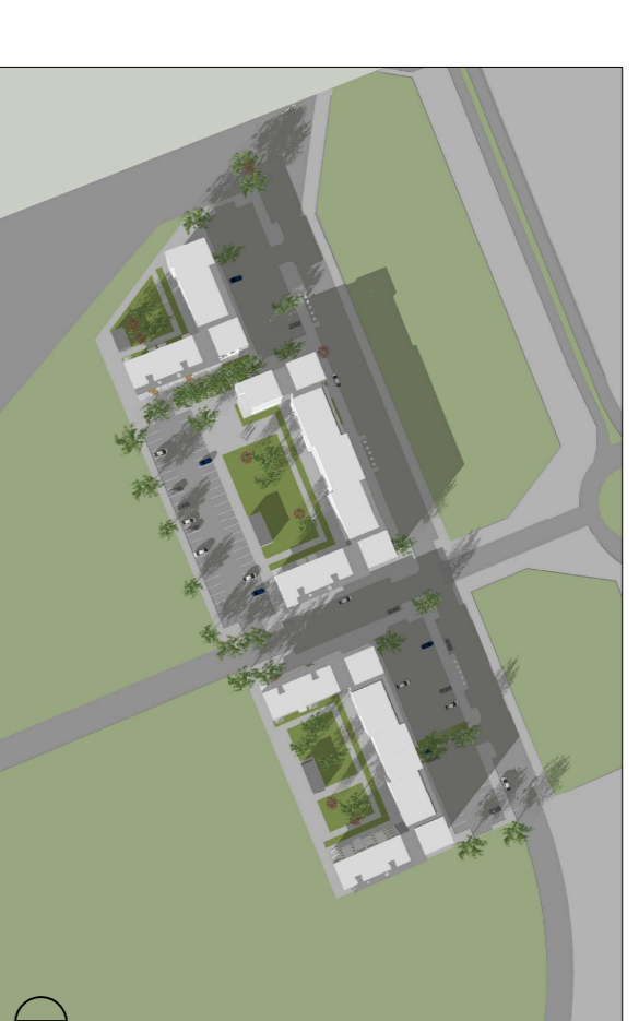
21.03 KL. 10.30