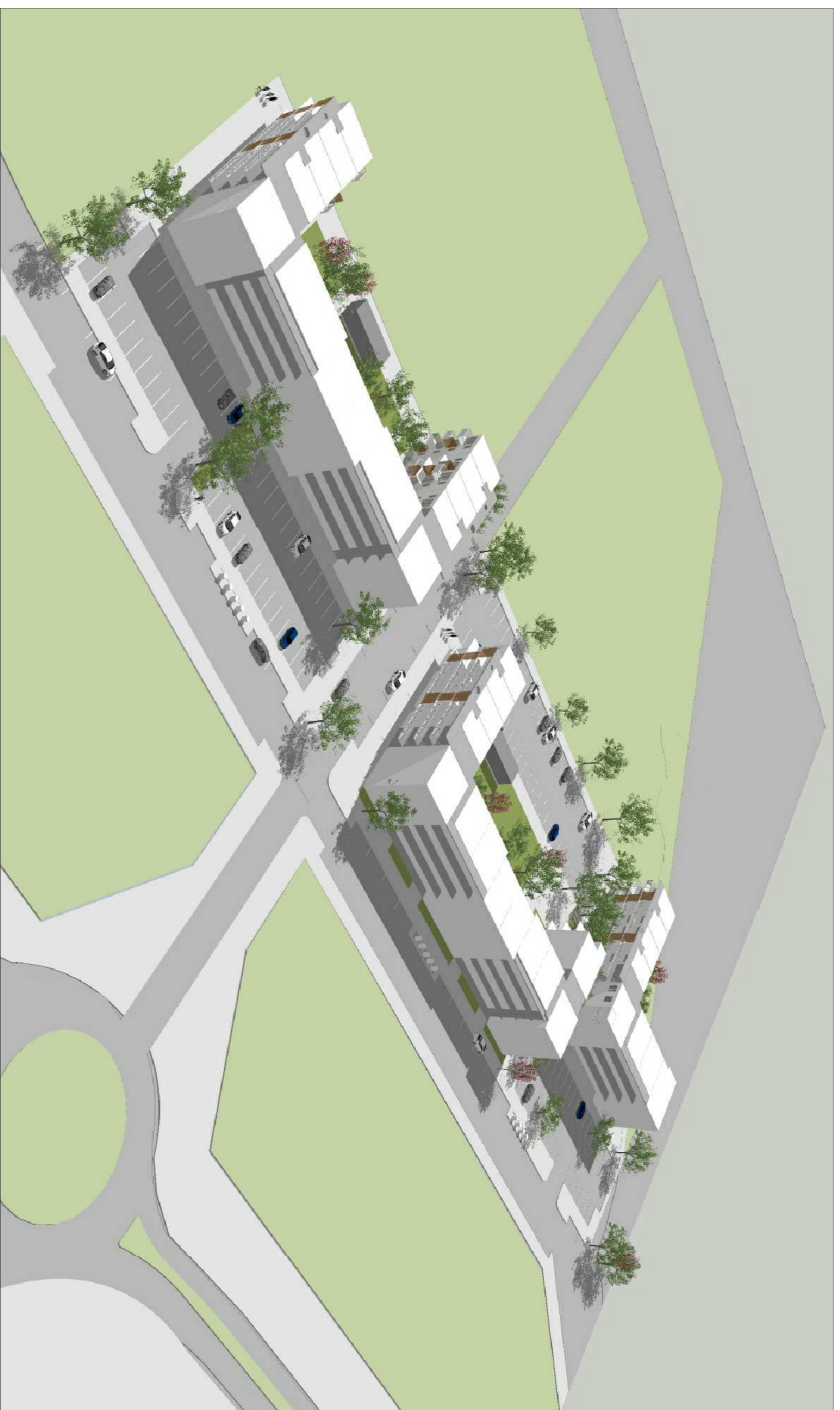
YFIRLITSMYND FRÁ NORÐRI