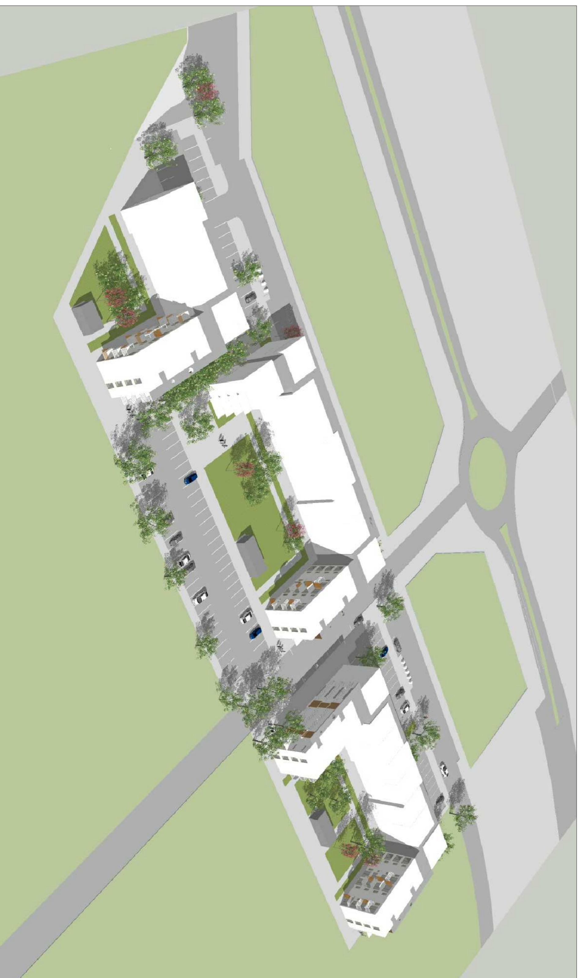
YFIRLITSMYND FRÁ SUÐRI