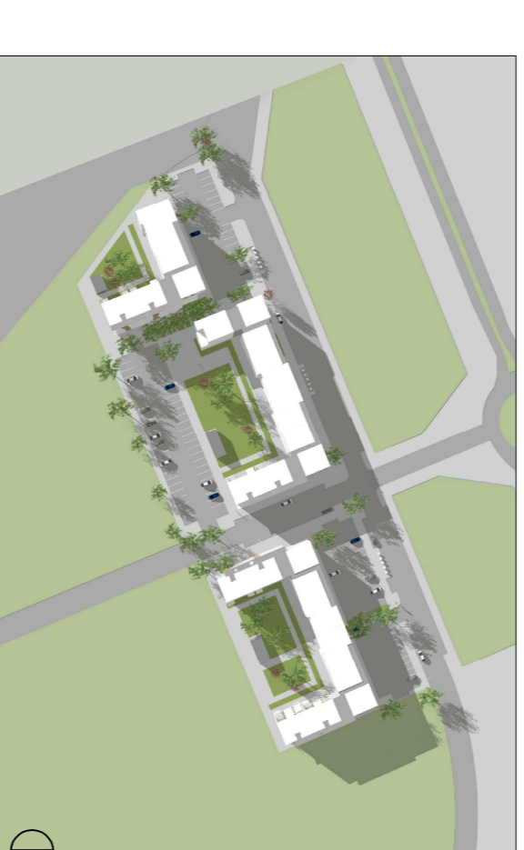
21.03 KL. 17.00