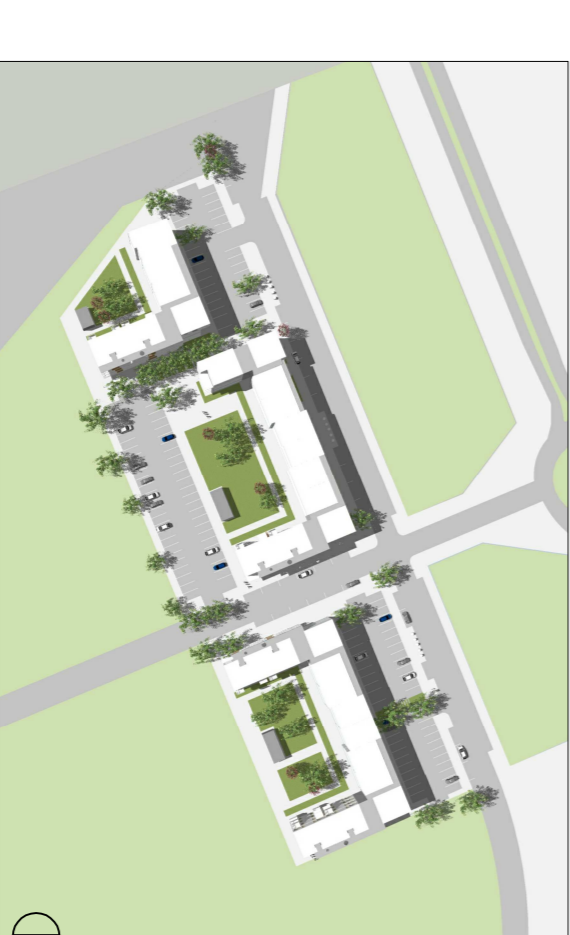
21.06 KL. 13.30