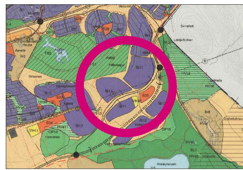
HLUTI AÐALSKIPULAGS HAFNARFJARÐAR 2013-2025